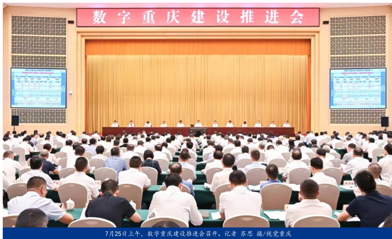
7月25日上午，数字重庆建设推进会召开。