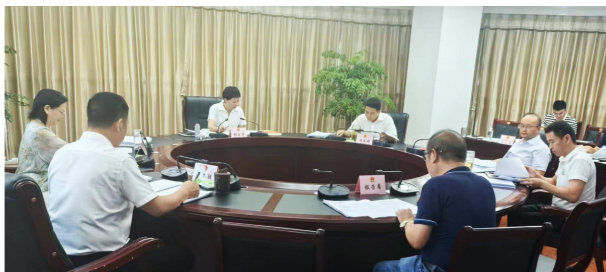
人大常委会主任彭玉萍主持召开第十八届人大常委会第44次主任会议