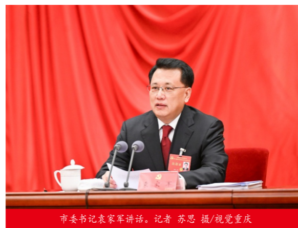
市委书记袁家军讲话。

审议通过《中共重庆市委关于深入学习贯彻习近平总书记视察重庆重要讲话重要指示精神奋力谱写中国式现代化重庆篇章的意见》和全会决议