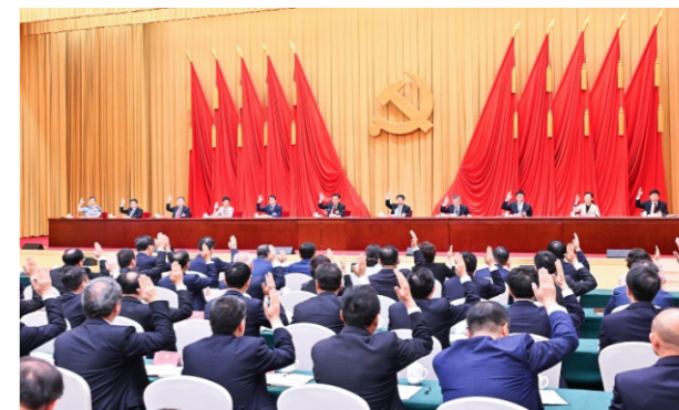
全会审议并表决通过《中国共产党重庆市第六届委员会第五次全体会议决议》。

全会强调，全面从严管党治党是落实总纲领总遵循的根本保证。要毫不放松坚持党的领导、加强党的建设，以高质量党建确保习近平总书记殷殷嘱托一贯到底。要锤炼提升党员干部特别是领导干部政治能力，学深悟透习近平总书记重要讲话重要指示精神核心要义、实践要求，巩固拓展主题教育成果，更好把学习成果不断转化为建设现代化新重庆的强大动力、为民服务的务实行动、干事创业的精神状态。要引导各级各部门真抓实干、积极进取、担当作为，坚持实干实绩正确选人用人导向，树立正确权力观、政绩观、事业观，进一步激励干部队伍敢闯敢干、敢作敢为，争当落实落地习近平总书记重要讲话重要指示精神的实干家、行动派。要深化整治形式主义为基层减负，健全基层减负常态化机制，完善基层权责清单管理制度和运行机制，规范督查检查考核，充分发挥舆论监督作用，总结提炼更多基层减负最佳实践，让基层干部把心思精力集中到落实习近平总书记殷殷嘱托和为群众提供最优服务上。要扎实开展党纪学习教育，做好《中国共产党纪律处分条例》解读和培训工作，抓好以案促学，教育引导全市党员干部知敬畏、存戒惧、守底线。要持续修复净化政治生态，时刻保持政治警醒，持续深入肃清孙政才恶劣影响和薄熙来、王立军流毒，深入肃清邓恢林流毒影响，涵养积极健康的党内政治文化，深化落实“十项举措”，营造风