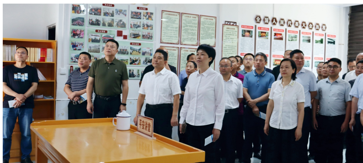
人大常委会主任彭玉萍率队视察平安镇“平安家园”建设情况