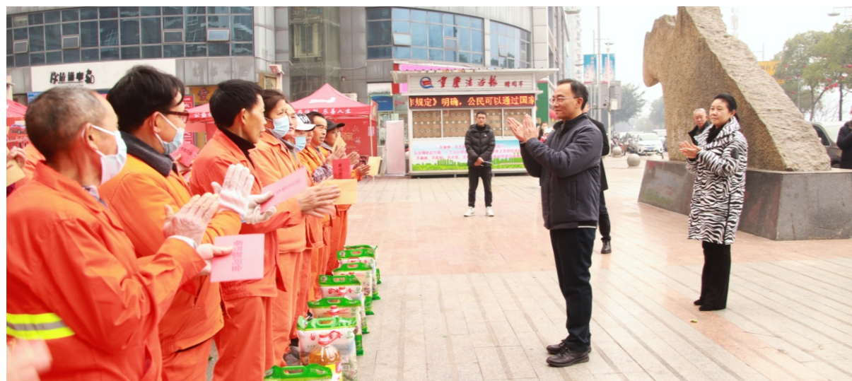
县委书记石强看望慰问坚守岗位的一线工作人员