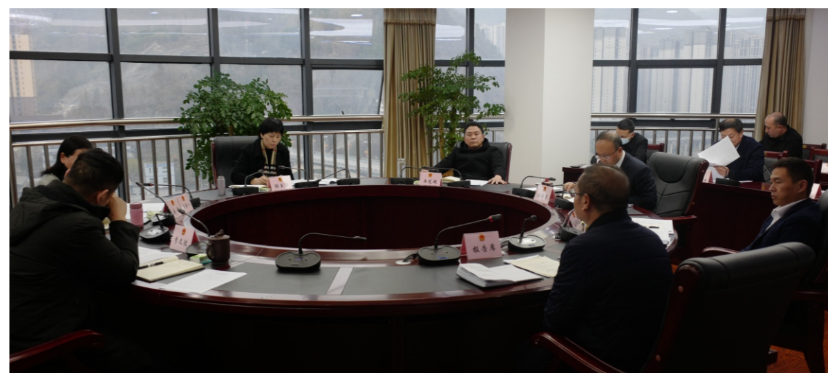
市人大常委会听取2022年乡镇（街道）人大工作评价情况汇报