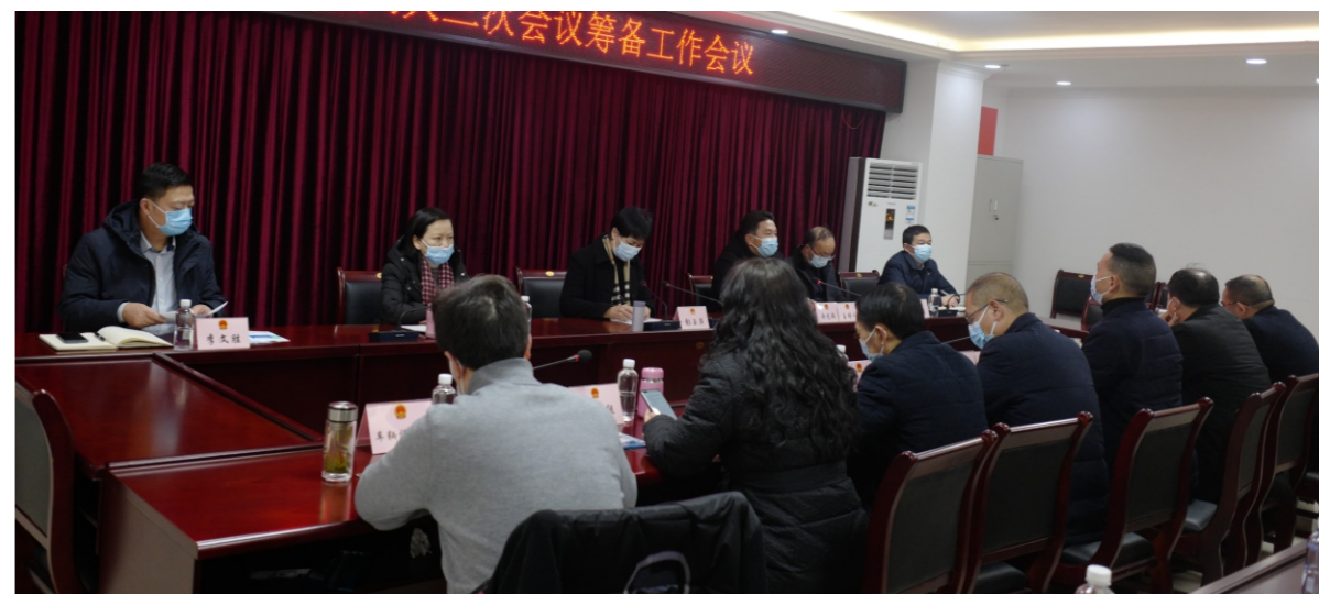
市人大常委会召开县十八届人大三次会议筹备工作会议